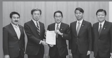
岸田総理大臣に、自民党提言の申し入れを行う秋葉領土特別委員長（総理官邸にて）