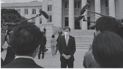
仙台放送、宮城テレビ等、地元のマスコミの取材・質問に応じる秋葉賢也衆議院議員