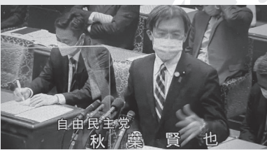
自由民主党 秋葉 賢也 コロナ禍で生活に困窮する学生支援のための奨学金支給要件の緩和を岸田総理に提言