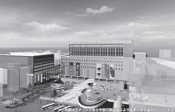
ヨドバシ仙台第1ビル 計画建物 配置計画

国土交通省はヨドバシ仙台第1ビル計画 整備事業を優良な民間都市再生事業計画として認定しました。 本事業では、仙台駅東口地区において、ゆとりある都市空間の形成を通じて、新たな賑わいや魅力の創出に取り組みます。