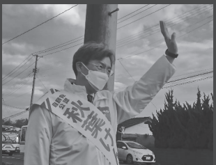
ロードサイドでご挨拶