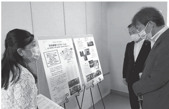
事業受託者である社会福祉法人の園長より「駅前送迎保育ステーション」の説明を受ける秋葉首相補佐官と流山市の井崎市長

流山市は、人口約20万人、転入超過数が4年連続で1位(政令市、特別区除く)の市です。出生率も1.67と県内1位です(平成30年度)。特筆すべきは、1人っ子(全体の15%)より、 3人兄弟(全体の24%) の方が多くことです。その理由として、待機児童解消のため、10年で認可保育所数を約6倍に増やし、今では市内のコンビニ数より多いそうです。特に力を入れているのが、市の事業である「 駅前送迎保育ステーション 」。市内に2カ所あり、計8台のバスで市内54の保育園等をまわります。流山市では、子育て世帯に特別な給付は行っておらず、子育て世代の日常をいかに便利にする事業を行うかが大事であると実感しました。