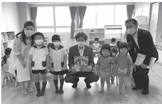
子どもたちから素敵な切り絵をいただきました!