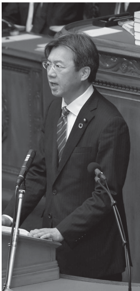
衆議院議員 秋葉賢也 環境委員長

いずれにしても、年金に限らず、医療や介護を含めた社会保障全般の充実にしっかりと取り組んで参ります。