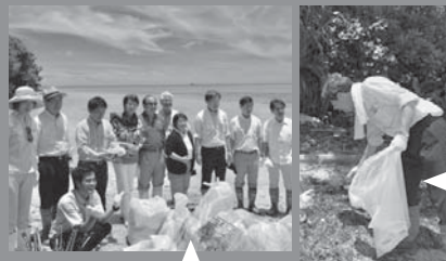
収集したごみの山

『 西表野生動物保護センター 』を視察 イリオモテヤマネコをはじめとする西表の絶滅のおそれのある野生動物の保護増殖事業、調査研究等を総合的に行う拠点として設置された『 西表野生動物保護センター 』を訪問し、野生動物保護の取組等概況説明を聴取しました。