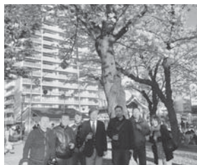
顧問をさせて頂いている畳組合役員の皆さんと