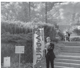
泉区加茂の長命館公園さくらまつり