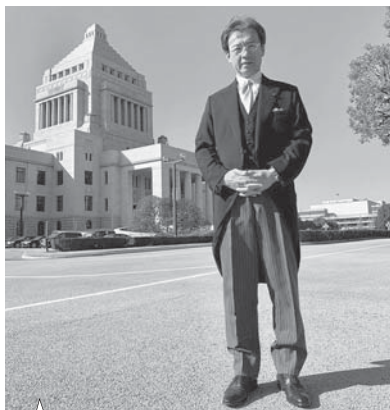
天皇陛下をお迎えし、第198回国会が開催。今上陛下の『平成最後の開会式』に出席し、感極まる表情の秋葉環境委員長。

1月28日第198回国会が召集され、平成最後の開会式が開催。衆議院正副議長や他の常任・特別委員会委員長との記念撮影に応じる秋葉環境委員長。