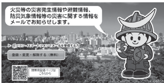
▲ 仙台市「社の都防災メール」ウェブサイトより引用

隣国・北朝鮮によるミサイル実験が今年に入ってから既に3回行われ、日本の排他的経済水域内に着弾しています。ミサイルが日本に落下する可能性がある場合、政府は、「Jアラート」を通じ、国民保護サイレンと緊急情報を国民に流すと共に携帯電話に緊急速報メールをお届けします!