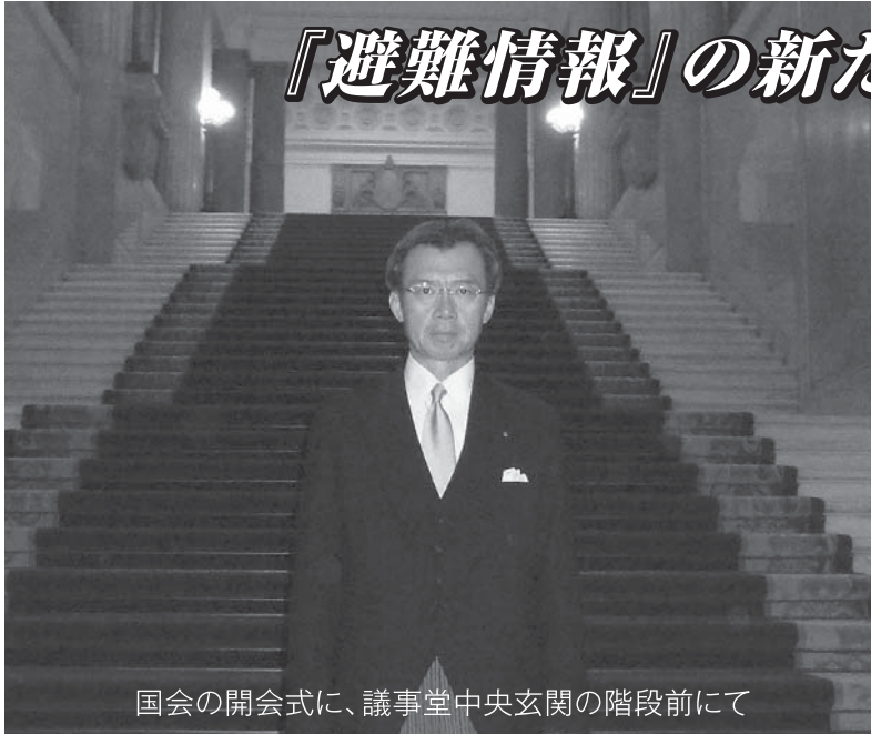
国会の開会式に、議事堂中央玄関の階段前にて

「天災は忘れたころにやって来る」とは、関東大震災を経験した寺田寅彦の言葉だと言われていますが、昨今は、忘れる間もなく多発傾向にある日本列島です。寺田は『天災と国防』の中で「文明が進めば進むほど天然の暴威による災害がその激烈の度を増す」とも指摘しています。