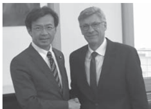
独) ストロッベ連邦保健省事務次官と意見交換