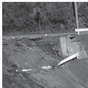
岩泉町の被災現場の現状