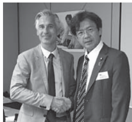
ベルギーにて、オルセン欧州委員会雇用局長と意見交換