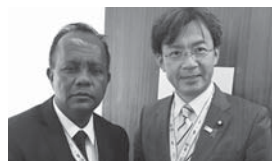
ラコバオ・マダガスカル農業社会資本大臣と。