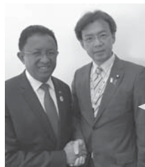
マダガスカルの大統領と