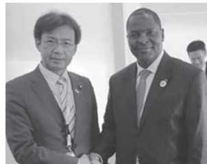
中央アフリカ共和国のトウアデラ大統領と意見交換