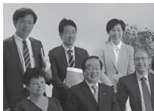
独) 高齢者センター・ディアコニー・ステーションを視察