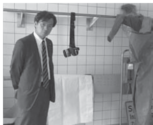
独) シャリテ医科大学病院を視察