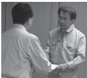
達増・岩手県知事より要望書を賜る秋葉委員長