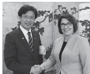
ポーランド議会・下院を表敬訪問