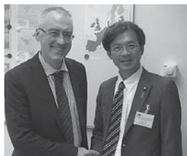
ルクセンブルグの欧州委員会保健局のライアン局長代行と懇談