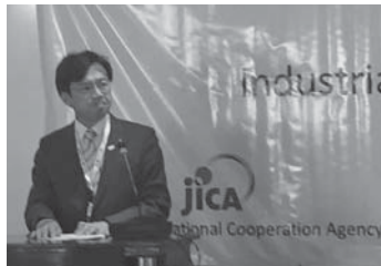
JICA主催の「アフリカの自立した産業振興 KAIZEN」セミナーで講演