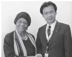
2011年ノーベル平和賞を受賞したザレーフ・リベリア共和国大統領と懇談