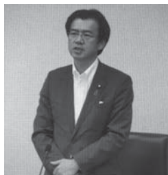
災害対策特別委員長に就任