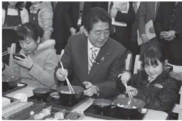
塩釜水産物仲卸市場を視察

秋葉代議士は、安倍晋三総理に同行し、21日、東日本大震災で被災した宮城県塩釜市の塩釜水産物仲卸市場、石巻市の新蛇田地区災害公営住宅・防災集団移転宅地やかき生産者、女川町の復興土地区画整理事業を視察致しました。