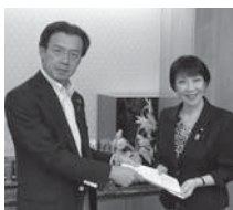
高市大臣へ要望書提出

27年11月、法務省・総務省より「(各都道府県知事・各市町村長あて)再犯防止対策の推進に対する御理解・御協力について」発出