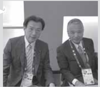
日本館の貴賓室で日伊友好議連会長の甘利大臣らと世界に誇れる日本食を美味しくいただきました。