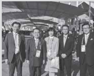
日本の伝統的な食文化を紹介する「日本館」は一番人気で大盛況。8時間待ちもあったそうで、日本館への来場者数は200万人を突破したそうです。