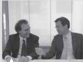
ダンブルオーゾ議連会長は、検察官出身の下院議員で、秋葉代議士と同じ1962年生まれ