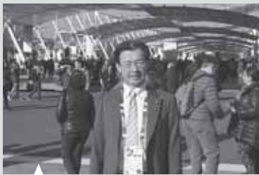
ミラノ博は、「地球に食料を、生命にエネルギーを」テーマに、今年5月から10月まで開催しています。