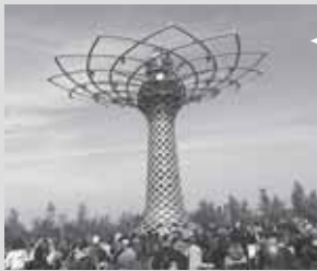
ミラノ万博のシンボル「生命の樹」のデザインは、ミケランジェロ。