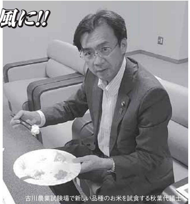
古川農業試験場で新しい品種のお米を試食する秋葉代議士