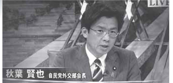
秋葉 賢也 自民党外交部会長

宮城県議会議員などを経て、2005年衆院初当選(当選5回) 総務大臣政務官、厚生労働副大臣、復興副大臣などを歴任