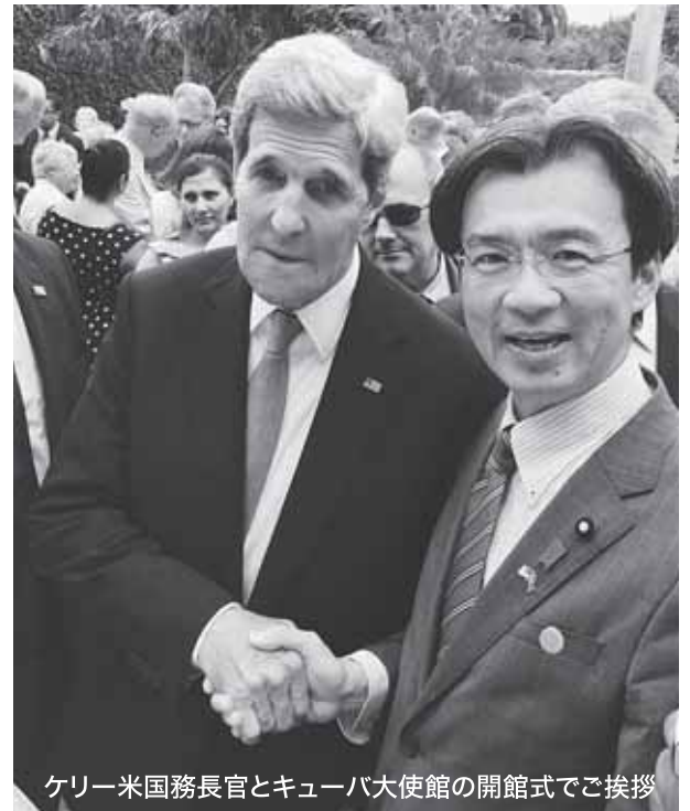
ケリー米國務長官とキューバ大使館の開館式でご挨拶

★キューバと医療連携進める 自民 党外交部会長の秋葉賢也氏（衆院宮城 2区）は、14日にキューバの首都ハバ ナで開かれた米大使館再開記念式典に 出席した。ケリー米國務長官と面会し た。「キューバとの関係構築に協力し て取り組むことを確認できた」と 成果を語る。