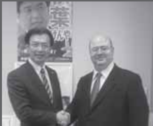
ヨルダン大使による表敬