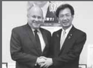
エジプト大使の表敬

カイラット駐日エジプト大使による表敬を受けた秋葉外交部会長は、中東和平におけるエジプトの大きな役割に期待を表明。