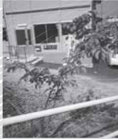
仙台事務所の桜の苗