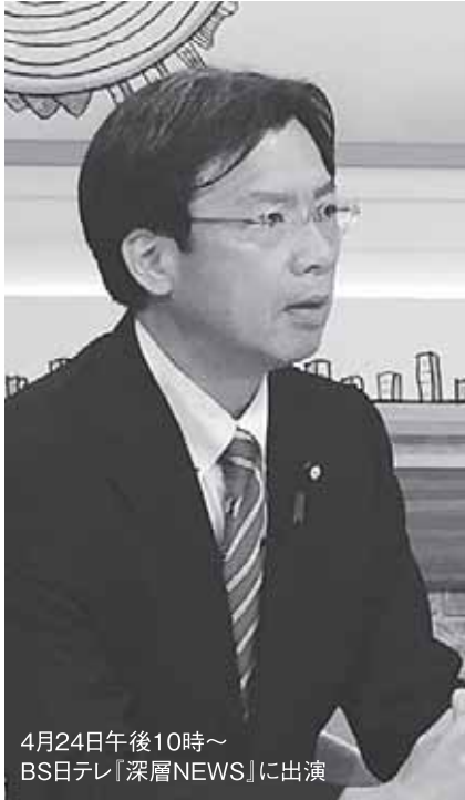
4月24日午後10時～ BS日テレ「深層NEWS」に出演