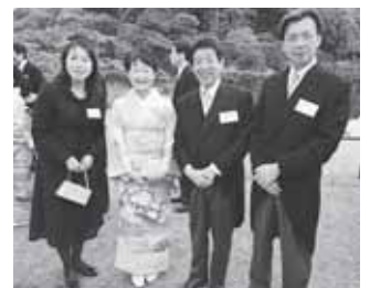
ノーベル賞受賞した天野教授と。塩崎厚生労働大臣ご夫妻と。