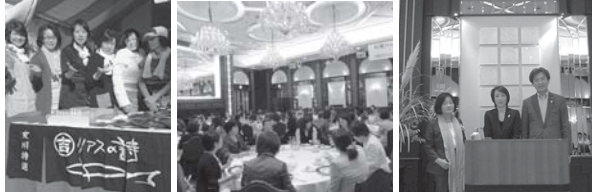
女性後援会「サロン・ド・リーフ」で参議院議員特別講演(左)を控えて～自身

【写真右】サロン・ド・リーフでは震災で工場がすべて流された女川のマルキチ阿部商店さんの復興支援のお手伝いをいたしました。