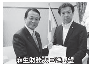
麻生財務大臣に要望