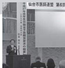
仙台市医師連盟 第6回