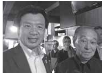
沖縄振興法を10年ぶりに改正したことが御縁となり、沖縄県の仲井真知事と懇談。