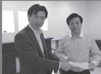
駐日中国大使館の韓公使に被災地産食品等の輸入条件緩和を要望!