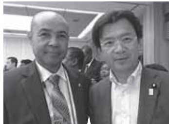
駐日マダガスカル大使館のマハオニソン大使からアイアイの誘致促進について確認しました。