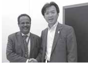
国際家族計画連盟のメッセ事務局長と国際人口問題について意見交換。