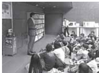
泉松陵小学校の皆さんが、国会議事堂見学に来て下さいました。とても礼儀正しい小学生の皆さんでした。