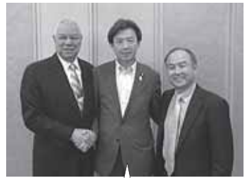
パウエル元米国務長官、ソフトバンクの孫社長と懇談。