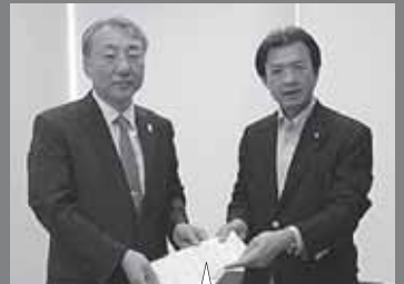
駐日韓国大使館の金公使に被災地産食品の輸入条件緩和を要望!