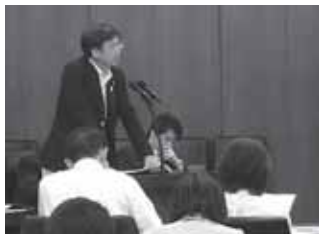
5日 衆厚生労働委員会で答弁