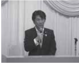
田村厚生労働大臣

愛知治郎参議院議員の司会進行に従い、田村憲久厚生労働大臣や根本匠復興大臣等からお話し頂き、盛会のうち幕を閉じることができました。ご多用にもかかわらず、ご出席頂きました皆様に、心から御礼申し上げます。