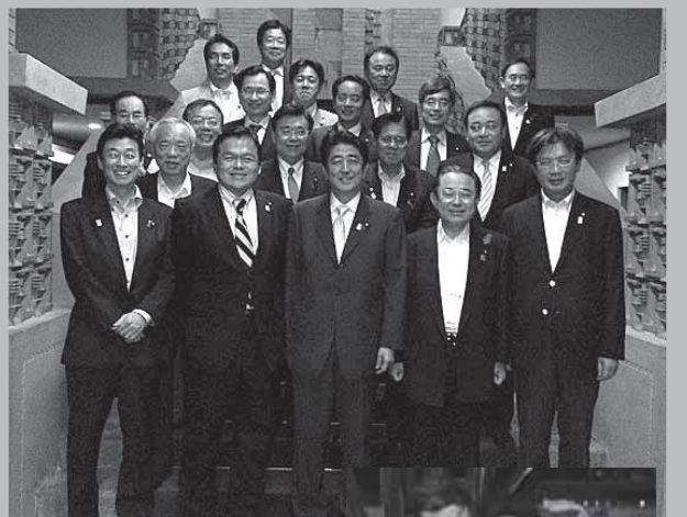
公邸(旧官邸)の入り口には、知恵の象徴とされる「ふくろう」の像があります。