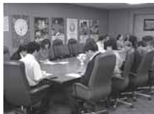
厚生労働省 幹部会議

多くの皆様にご購読いただき心より感謝申し上げます。全国の主要書店やアマゾン等のインターネットでもお求めいただけます。