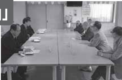
国立療養所「多摩全生園」を訪問した秋葉副大臣。