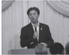
秋葉厚生労働副大臣及び復興副大臣