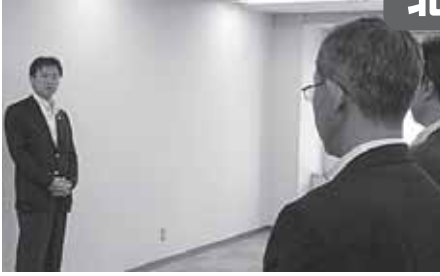
北海道厚生局にて職員の皆さんに訓示。