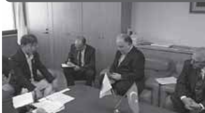
クルチ駐日トルコ大使と、日・トルコ協力関係について意見交換