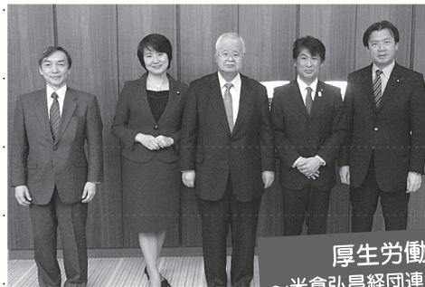
厚生労働省政務三役 ～米倉弘昌経団連会長に就任のご挨拶～