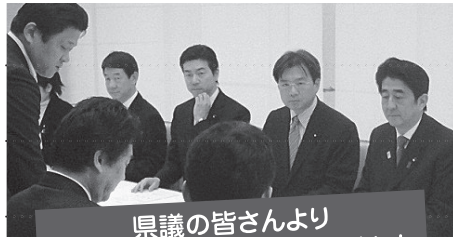
県議の皆さんより 復興に関するご要望を賜りました