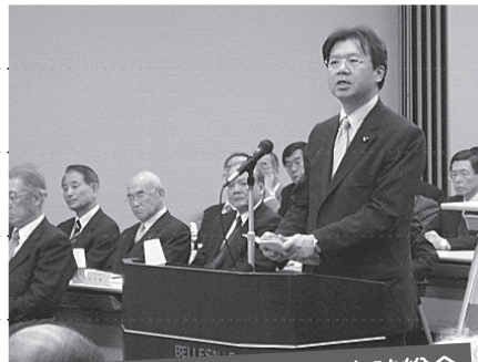
第188回健康保険組合定時総会 ～秋葉厚生労働副大臣よりご挨拶～