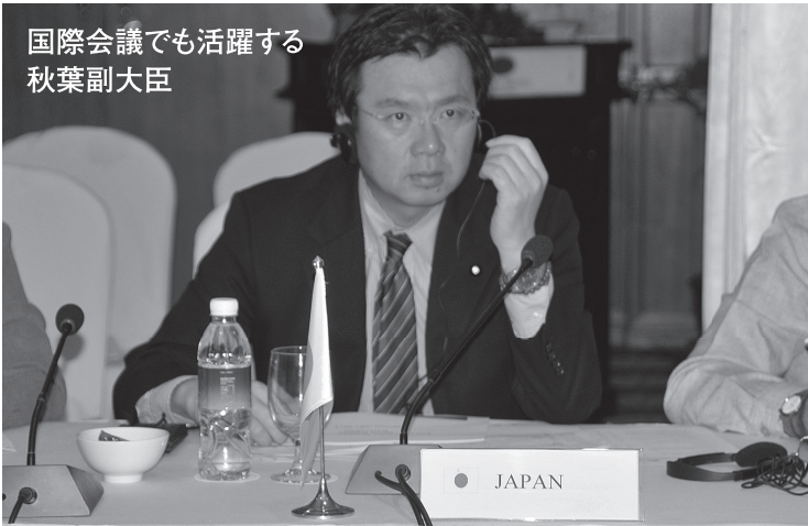
国際会議でも活躍する 秋葉副大臣