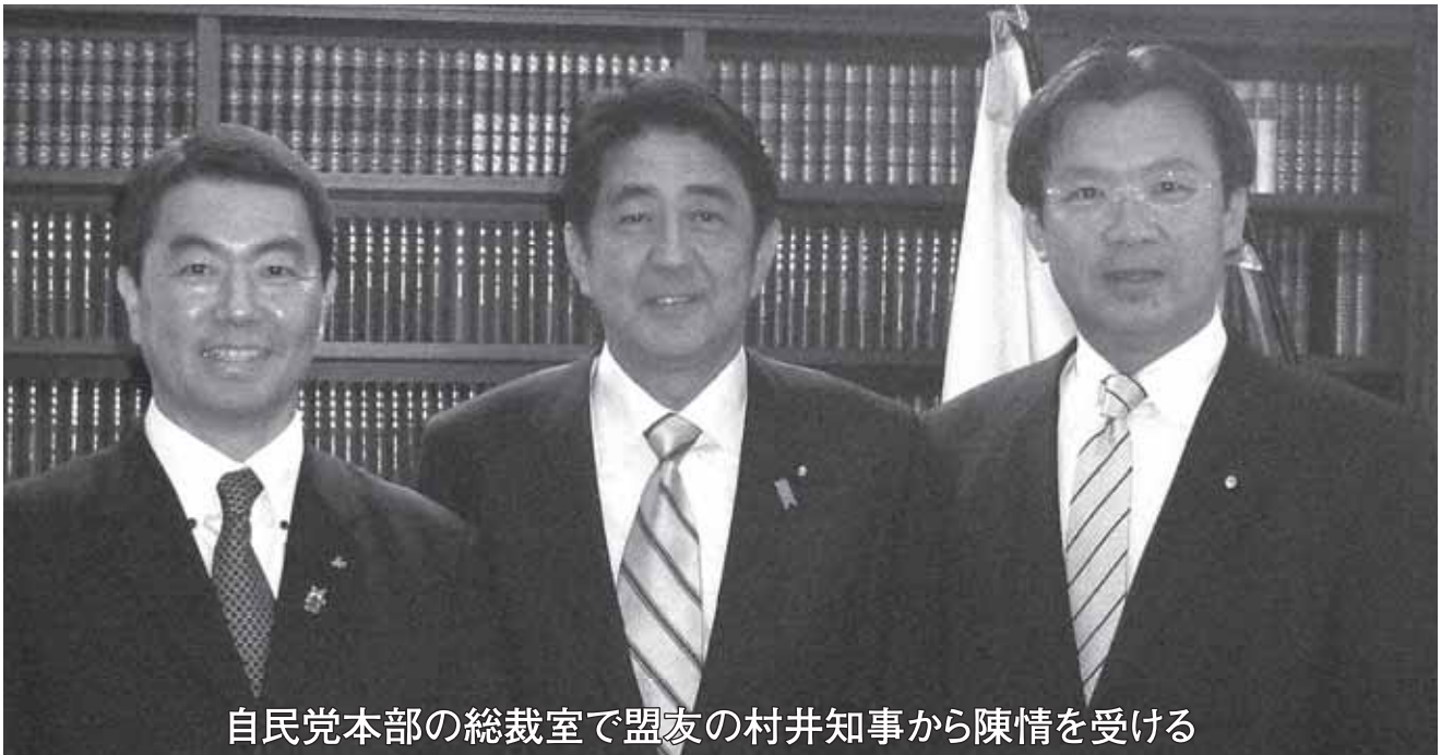
自民党本部の総裁室で盟友の村井知事から陳情を受ける

ご案内の通り衆議院が解散され、12月16日が投票日になりました。約3年3ヶ月の間、自民党は野党第一党として、「批判よりも具体的な提案」を重視して取り組んで参りました。