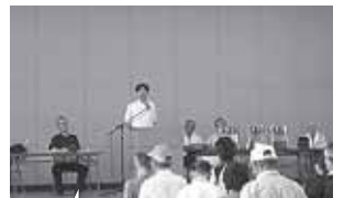
西部地区連合町内会球技大会訪問致しました!

スポーツランドSUGOで開催された、東北復興支援の第1回ジャパンサイクルレースに招待され、レースを観戦致しました。レースは、100km、50km、25kmクラスに別れ、それぞれソロ部門、リレー部門、ママチャリ部門で1000人を超す参加者が健脚を競いました。