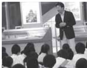
丸森中学校の皆さんの国会議事堂見学!

丸森中学校は、昨年3月末に廃止された秋葉代議士の出身校である大内中学校と、他2校が統合される形で今年4月に新設された中学校です。初々しさが感じられる中学生の皆さんに、エールを送るのようにより力強くお話しさせて頂きました。