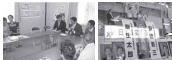
安倍候補の秋葉原での街頭演説を支援

20日、宮城県入りした安倍候補は、荒浜慰霊塔で犠牲者に追悼の意を捧げた後、鶴巻仮設住宅を訪れ住民の皆さんと懇談し、その後、仙台の経済人の皆さんと懇談しました。