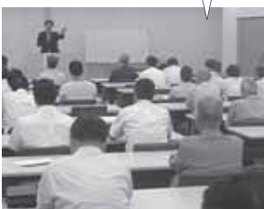
顧問を務める業界の関係者の方々と意見交換させて頂きました