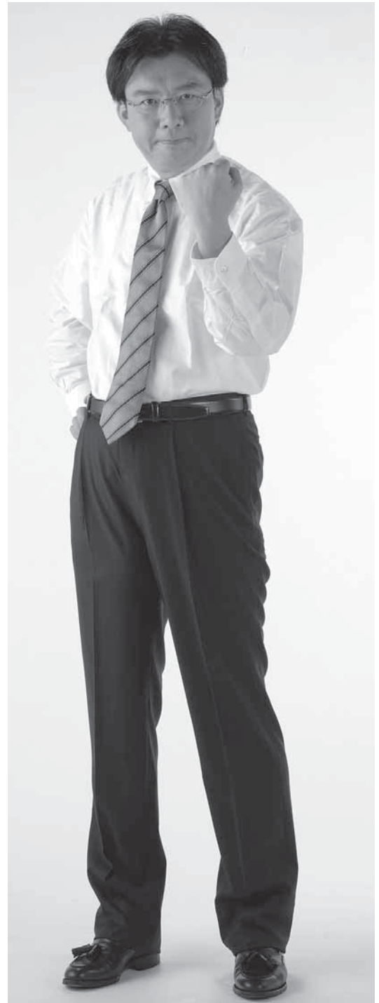
衆議院議員 秋葉賢也 自民党副幹事長

これからも国民の皆さんのニーズを的確に汲み取り、決して官僚任せにすることなく、自ら積極的に議員立法に取り組み、その立案の中に、国民の願いや憂いといった生の声をしっかりと反映させていきます。