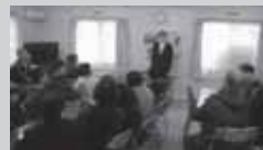
幼稚園の地被害についてお話を伺いました。