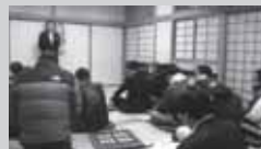
「国政親睦会」を開いてみませんか?