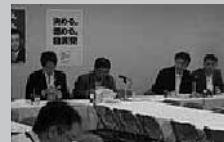
行政改革(サンセット)法案 国会提出へ向けて