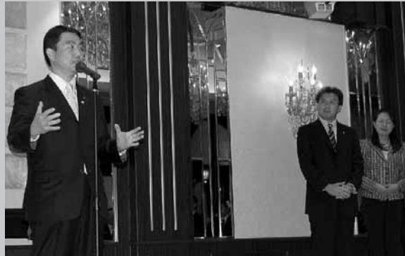
秋葉賢也著「松下幸之助『最後の言葉』」出版記念パーティで 盟友の村井県知事よりご挨拶