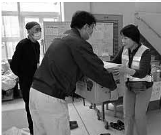
▲被災地の皆さんのニーズをすばやくキャッチ!