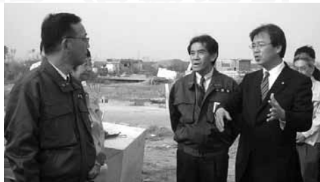
▲谷垣自民党総裁が被災地仙台を再視察