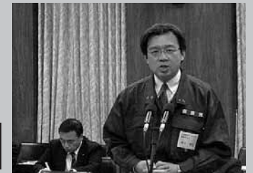
災害対策特別委員会 現地の声を反映した復興施策を!