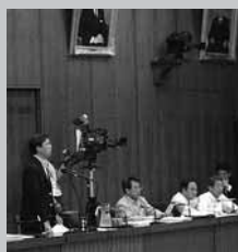
総務委員会～NHK決算審議～