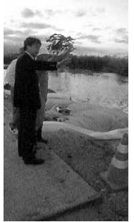
▲仙台東部沿岸の防波堤