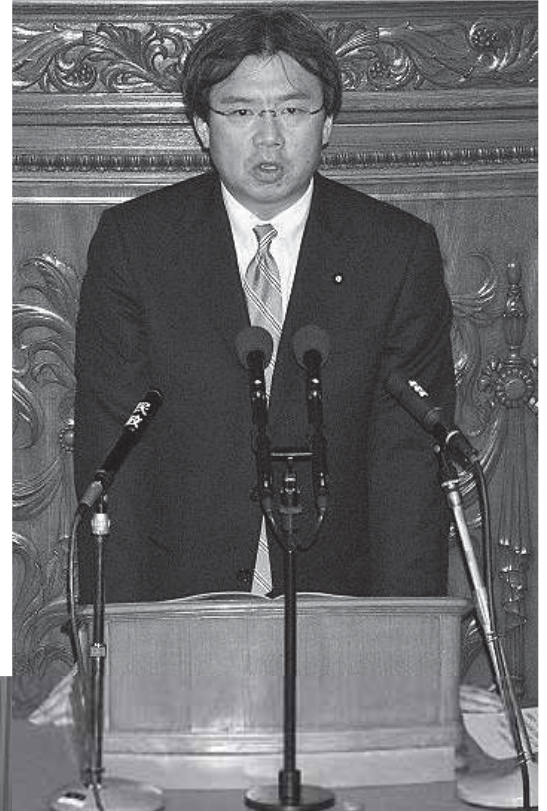
[2011年7月 衆院本会議場にて]