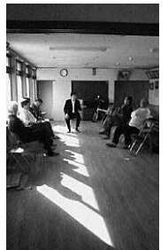
▲岡田地区で行った座談会