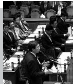
震災復興特別委員会 被災地のための効果的復興策を!