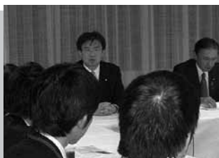
党中央政治大学院にて講義