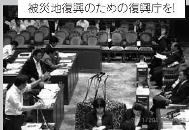
被災地復興のための復興庁を!