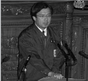
本会議において特措法改正案について説明