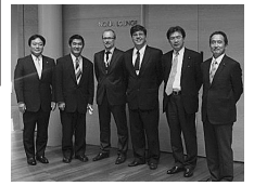
携帯電話端末市場でトップのノキアの幹部の方々と。会社の公用語は英語。ノキアの外国人従業員は3割以上。