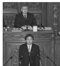
議員立法で改正案を提案し、本会議で趣旨説明に登壇する。罰金規定を設けるなど天下り禁止を強化。