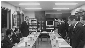
更正保護議連の視察を行う。事務局長として視察を取りまとめる。渋谷区両全会を訪問。