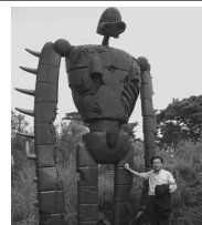
ジブリ美術館館長と懇談。