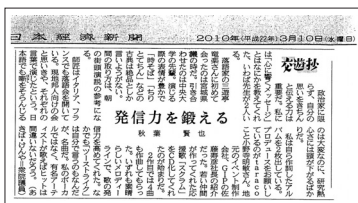
日経新聞の交遊抄3/10。政治家にとって言葉は命です。言葉に責任の持てる政治を!