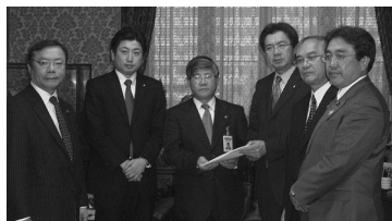
天下り禁止強化! 天下りに罰則規定を設けた法案の提出者となる。改革への本気を行動で示す。