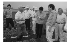
農家の方々と意見交換。