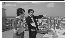
東北大学病院を視察し、ドクターへの活用状況を意見交換。