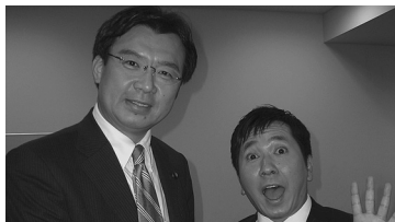
日テレ「太田総理」に出演。昨年12月4日から約5ヶ月ぶりの出演でした。