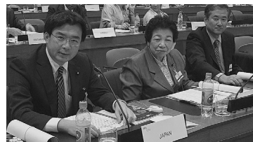
APDAメンバーを代表してエチオピアで開催された国際会議で演説。「ODAについて」語る。