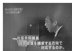
尖閣諸島漁船事件を追及し、NHKニュースに取り上げられる。