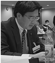
久しぶりに英語でのスピーチ！

エチオピアで「第4回国連人口開発会議行動計画実施のための国際国会議員会議」が開かれ、日本代表として福田康夫元総理大臣らと共に参加してきました！出席者は世界各国の人口・開発議員連盟のメンバー議員200名以上に加え、政府・国際機関・NGO 代表や専門家など、総勢400名以上にのぼりました。