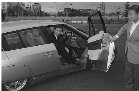
Elica は、4人乗りセダンで最高速度370km/hを走行できる、まさに21世紀型技術を応用した電気自動車です。