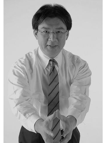
月曜朝7時～9時は駅頭で街頭演説を行っています！

しかし現実には、日本経済の国際競争力は年々低下しており、昨年の8位から今年には9位に下落するなど極めて深刻な状況です。やはりバラマキ型の予算措置ではなく、日本企業の成長力や国際競争力を高めるためのもっと大胆な戦略が不可欠であり、将来を見据えた選択と集中による思い切った投資を国を挙げて実施することが必要だと思います。例年12月は来年度の予算案や税制が決まる大事な時ですが、国益を踏まえてしっかり主張して参ります。