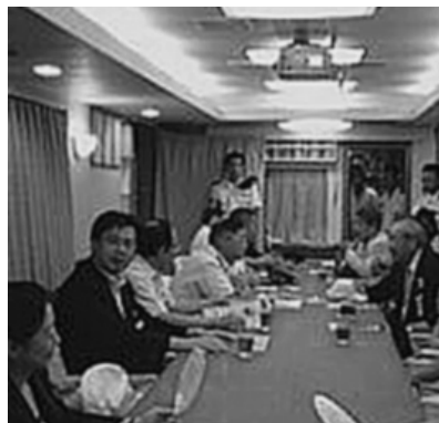
(護衛艦「はるさめ」に乗艦し職員の方々と懇談する秋葉代議士。)

房長官・副長官、総務副大臣・大臣政務官を囲んだ記念写真の撮影も行われました(官邸正面2階の階段にて)