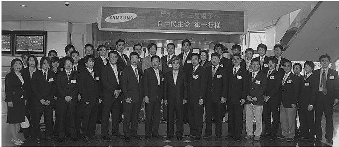
サムソン電子本社の正面玄関前にて記念撮影

I. サムソン電子社は、ソウル特別市内にあります。今回のサムソン電子視察では、1980年代初めに半導体事業への本格的参入を果たし、90年代後半から急速な発展を遂げた「サムソン」の経営戦略について広報担当者から説明を受けると共に、液晶パネルを使ったデジタルテレビ等のサムソン・ブランドの製品を見学致しました。1990年代後半から、独自のブランド化に成功し海外展開を果たしたサムソン電子。今回の視察では、「アナログからデジタルへの転換」や「ウォン安」といった環境変化に的確に対応し、「事業の選択・集中」や「デジタル時代に対応したデザイン重視、Samsung ブランドの構築」などを次々に実践していったサムソンの見事な経営戦略を直に学び、感じることができました。