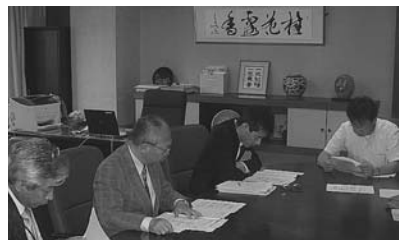
石川行政評価事務所にて

総務省行政評価局は、行政内部にありながら、各府省とは異なる立場から行政運営の改善をはかるため、主に合規性、適正性、効率化等の観点から、行政機関の常務の実施状況を調査し、その結果に基づき行政機関に勧告を行っています。今回の視察では、東京・沖縄・石川行政評価事務所の各担当から業務概況について詳細な報告を受けました。