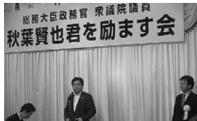
増田寛也総務大臣