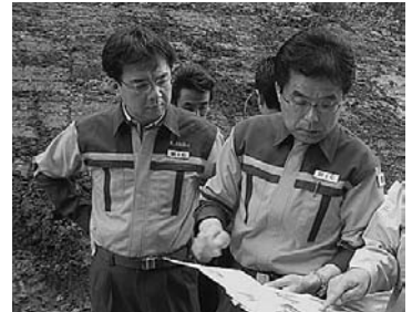
岩手・宮城内陸地震で増田総務大臣と共に現場視察を行う秋葉政務官

去る6月14日に発生した「岩手・宮城内陸地震」では、マグニチュード7.2、最大震度6強を記録し、死者12名、行方不明10名(7月1日現在)という大きな被害をもたらしました。謹んでご冥福をお祈りするとともに被災者の皆様に心からお見舞い申し上げます。行方不明者の徹底捜索はもちろんライフラインの早期復旧など一日も早い復興に向けて尽力して参ります。