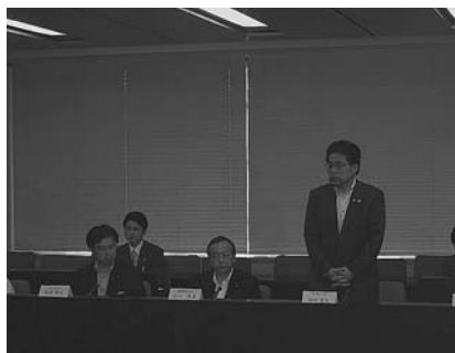
第二回地上デジタル放送総合対策本部にて

2011年の完全デジタル化に向けた対策を検討するために、第二回地上デジタル放送総合対策本部が総務省で開催されました。地方における完全デジタル化の実現には、市町村への周知を徹底することが必要であり、政府一体となった体制強化をすすめて参ります。