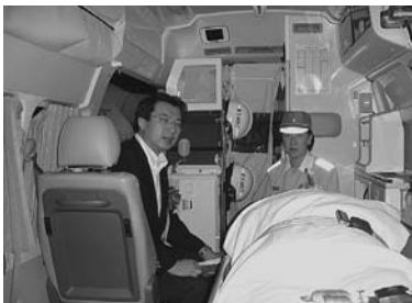
高規格救急車の内部にて

東京ビックサイトで開催された「東京国際消防防災展2008」に総務大臣政務官として招待頂き、消防演習・デモンストレーション見学をはじめ、はしご車・ポンプ車への体験乗車等、首都東京が直面している自然災害・人的脅威等のリスクに応じるための防災最先端技術を学ぶことができました。安全・安心な都市の構築には、官民一体となった積極的関与が重要であることを改めて確認致しました。