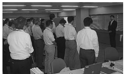
年金記録確認東京地区第三者委員会にて

また総務省の年金記録確認第三者委員会の視察も行い、職員を前に訓辞し、年金記録問題の解決のために委員会が適切且つ迅速に事案を処理することが重要だと述べました。