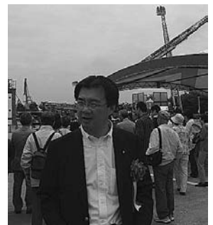
高さ40mまで到達可能なはしご車の前で

東京ビックサイトで開催された「東京国際消防防災展2008」に総務大臣政務官として招待頂き、消防演習・デモンストレーション見学をはじめ、はしご車・ポンプ車への体験乗車等、首都東京が直面している自然災害・人的脅威等のリスクに応じるための防災最先端技術を学ぶことができました。安全・安心な都市の構築には、官民一体となった積極的関与が重要であることを改めて確認致しました。