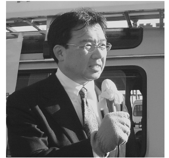
わかりやすい身近な政治を実現するため、国会議員になってからも、毎週月曜日早朝2時間の街頭演説を続けています。

目前の困難から決して逃げることなく、そして、国民に耳障りの良い無責任な政策に迎合することなく、正々堂々と議論して参ります。