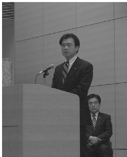
総務省職員の前に、新年のご挨拶

国民の皆さんのニーズに応じた多様な政策課題に対して、積極的で真摯な討論を通じ、具体的な諸施策の実現に取り組んで参ります。