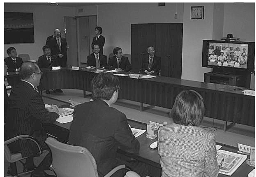
南極の昭和基地で働いているスタッフの皆さんと インターネット衛生回線を通じて懇談しました。