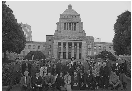
見学を終えた後、国会議事堂前にて記念撮影。