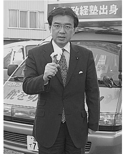
わかりやすい身近な政治を実現するため、国会議員になってからも、毎週月曜日早朝2時間の街頭演説を続けています。

どれも重要な施策だが、私は特に、うつ病などの精神病対策の充実と遺族へのフォローアップの充実の2つが急務だと思う。自殺者の大半に精神疾患が認められることから、うつ病などの受診率を向上させるなど、適切に精神科医療を受け易い体制を構築することが、最も実効性の高い施策だと考えるので、適宜その進捗状況を把握していきたい。精神病というわが国ではまだまだ偏見も根強いが、国民の理解が進むように一層啓発にも力を入れていきたい。