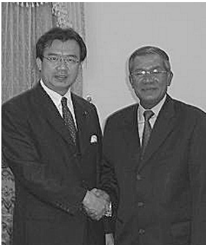
カンボジアのフン・セン首相と