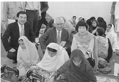
(ムザファラバード加藤センター)

加藤センターは、日本の草の根・人間の安全保障無償資金協力で設立されました。基礎保健医療の提出、女性を対象とした職業訓練、母子保健・家族計画教育等を目的としており、訪問時には多くの女性が裁縫を学んでいました。