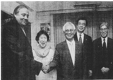
(チョードリー人口福祉大臣との会談にて)

今後の国際機関を通じた日本政府による海外援助や ODA の有効なあり方を検討する目的で、パキスタンにある国連人口基金、国際家族計画連盟、そして日本政府がパキスタンで行っているプロジェクトサイト（人口、安全な水、貧困、HIV/エイズ、農村開発、公衆衛生、セクシュアル・リプロダクティブ・ヘルスなど）を訪問し、国連人口基金、国際家族計画連盟、日本政府の支援の実情と、インドの人口・開発状況を視察すると同時に、パキスタンの要人と会談させて頂き、両国の友好関係強化について意見交換いたしました。