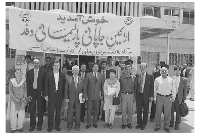
(NGO パキスタン家族計画協会事務所にて)