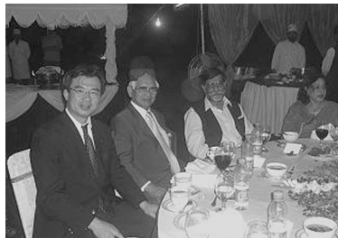
(スムロ上院議員主催の夕食会にて)