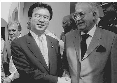
(カシミール大統領と)

2005年のパキスタン大地震で壊滅的な被害を受けたムザファラバード市。JICAによるムザファラバード復興・復興支援の一環として、耐震構造を備えた学校として設立されたムティパーク女子学校校舎前で。