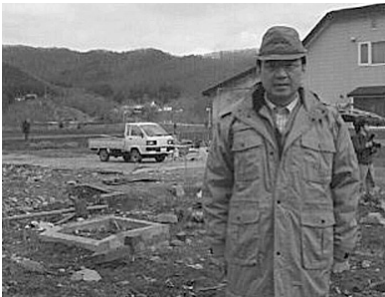
(△：風で全壊した民家跡の前にて)

9月には宮城県延岡市で発生した竜巻被害を視察し、その壮絶な破壊力を目の当たりにしてきたばかりでした。