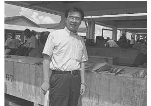
(ダルエスサラーム魚市場にて)

タンザニアと日本の関係は特に経済面で強く、日本は、タンザニアの輸出相手国第3位、輸入相手国第2位になっています。日本の無償資金協力で水揚げ護沿が設置され店舗整理が行われたため、衛生環境が改善し、市場利用者が1日当たり約11,000人を超えるようになった、ダルエスサラーム魚市場を見学いたしました。