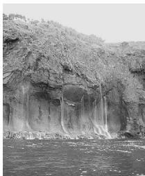
△斜里町側の海岸線

知床は昨年7月のユネスコ世界遺産委員会で、世界遺産(自然遺産)として登録されました。鹿児島県の屋久島、秋田県・青森県にまたがる白神山地に続き、日本で3番目に登録された北海道の知床。