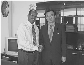
(ジブチのユスフ外務・国際協力大臣と)

アフリカ大陸には53の独立国家が存在し、それぞれ異なる言語・人種・文化をもっており、非常に多様性豊かであるという印象を受けました。ここでは、秋葉代議士が訪問した諸国のうち3カ国の簡単な説明と秋葉代議士の海外での活動をご報告いたします。